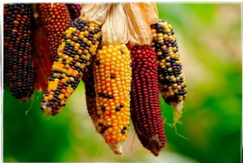
Figura 1. Tipos de maíz en México

Las imágenes y cuadros deberán ser completamente legibles.